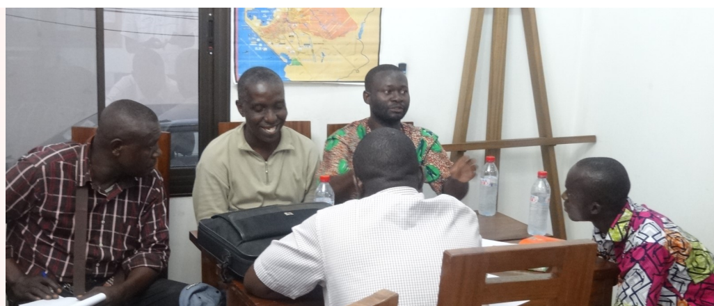
Soirée « Bimoko Ya Kisalu »

Un partenariat réussi est un partenariat qui se noue dans la durée : avant de se lancer dans l'aventure, CGED accompagne les entrepreneurs à découvrir ce qui est le plus important pour eux et l'avenir de leur entreprise. Cela leur permet d'identifier avec qui ils pourront travailler durablement.